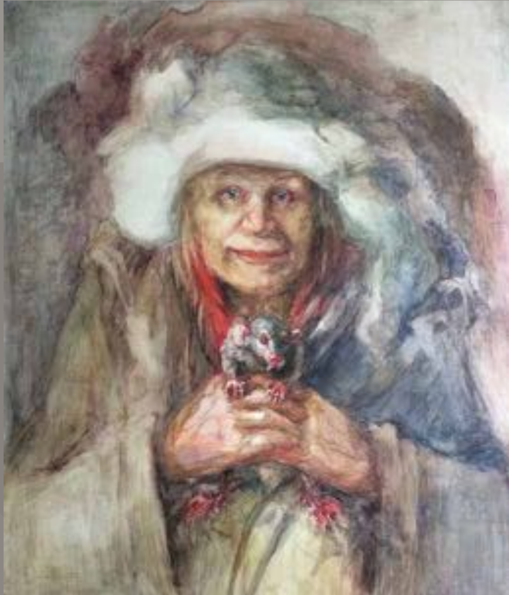
96 x 112 cm, Tempera op karton / EUR 1000 excl. lijst olgabijzitter.nl