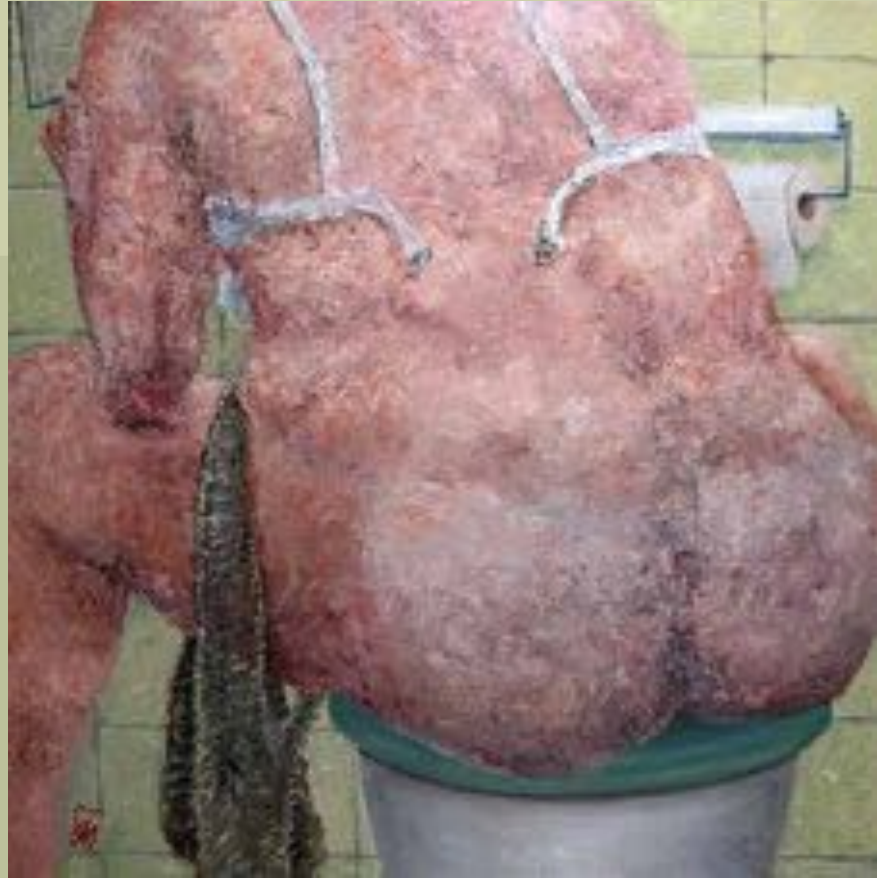
60 x 60 cm, Olieverf op kastdeur / NTK petertholen.nl