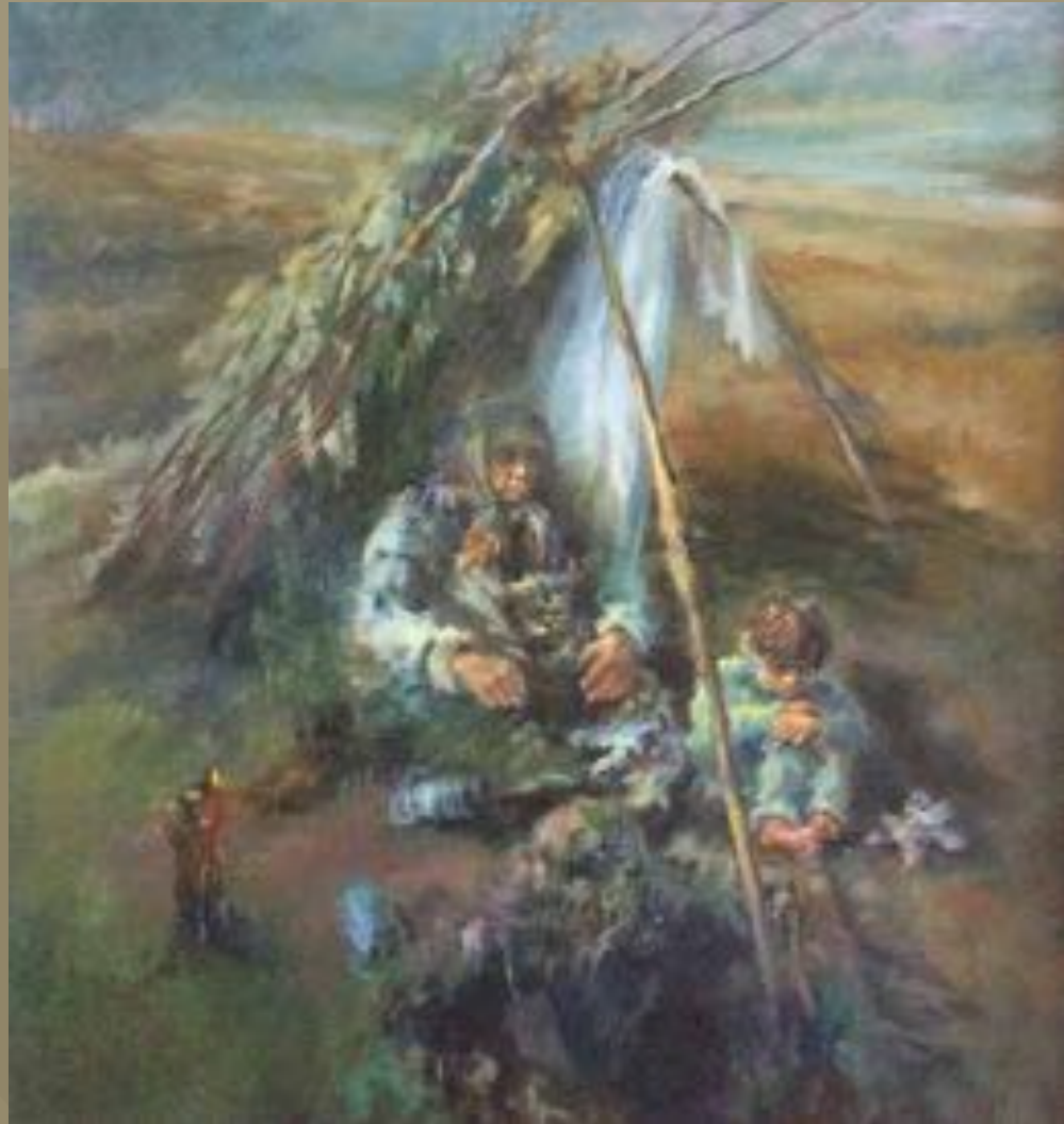
76 x 89 cm, Olieverf op paneel / EUR 1800 excl. lijst olgabijzitter.nl