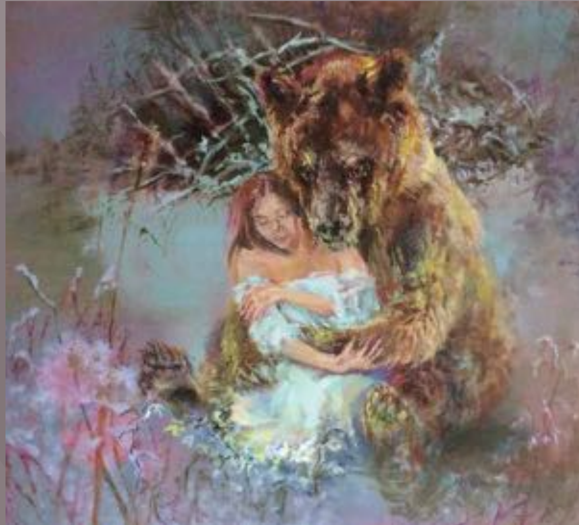
80 x 72 cm, Olieverf op paneel / EUR 2300 excl. lijst olgabijzitter.nl