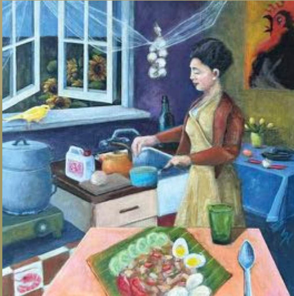
37,5 x 37,5 cm, Acryl op paneel / NTK suzanneheijligers.nl